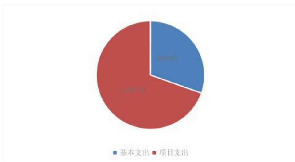
图 3：支出决算构成情况（按支出性质）（单位：万元）

本单位 2021 年度本年支出合计 1,677.66 万元，其中：基本支出 509.93 万元，占 30.4%；项目支出 1,167.73 万元，占 69.6%。如图所示：