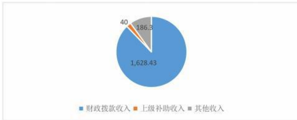
图 2：收入决算构成情况（单位：万元）