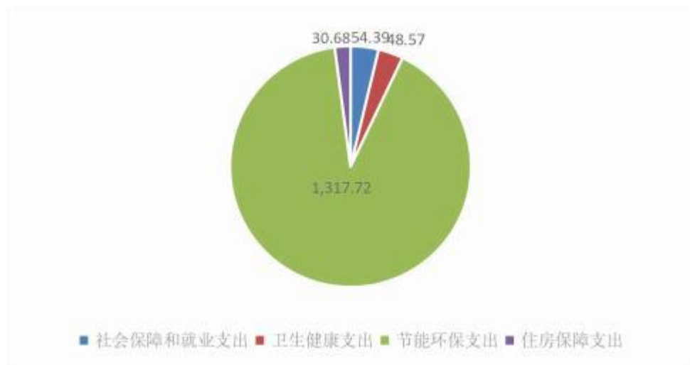
图 6：财政拨款支出决算结构（按功能分类）（单位：万元）