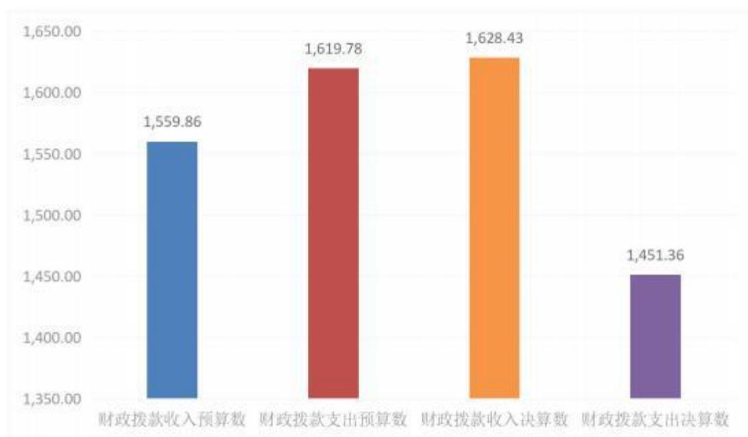
图 5：财政拨款收支预决算对比情况（单位：万元）

1,451.36 万元，完成年初预算的 89.6%，比年初预算减少 168.42 万元，决算数小于预算数主要原因是主要是人员经费支出减少。