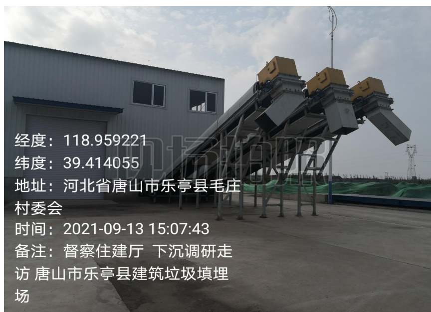
乐亭县建筑垃圾消纳场破碎机无使用痕迹

唐山市乐亭县建筑垃圾消纳场，建筑垃圾破碎设备无使用痕迹，未开展过建筑垃圾综合利用；场内及场区周边建筑垃圾随意倾倒，无任何污染防治措施。