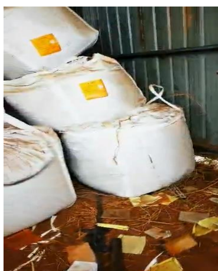
中节能（沧州）环保能源有限公司飞灰在泥土地面贮存