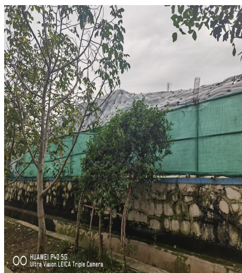
玉田县生活垃圾填埋场超库容运行，填埋区地上高度高达 15 米左右

环评文件要求，该垃圾填埋场有效库容为 73 万立方米，填埋区地上高度为 10 米。垃圾填埋场相关人员汇报，已填埋生活垃圾 88 万立方米，提供不出运行以来生活垃圾填埋台账。督察发现，该填埋场库存已经远远超出填埋库容量，多处地上高度达到 15 米左右，1 万多平方米垃圾露天堆存，未采取相应污染防治措施，雨污分流不到位，多处积存渗滤液，运行管理不符合《生活垃圾卫生填埋处理技术规范》（GB50869-2013）和《生活垃圾填埋场