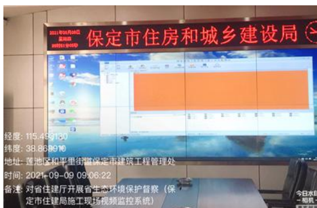
保定市住建局建筑施工工地视频监控平台停机

2021 年 9 月，省第十三生态环境保护督察组下沉保定市发现，市住建局建筑工地视频监控平台自 2019 年 12 月起因未缴纳网络费用，至督察时一直停用；商砼企业的视频监控设施未接入监控平台；督察组抽查的部分施工工地扬尘污染问题突出。