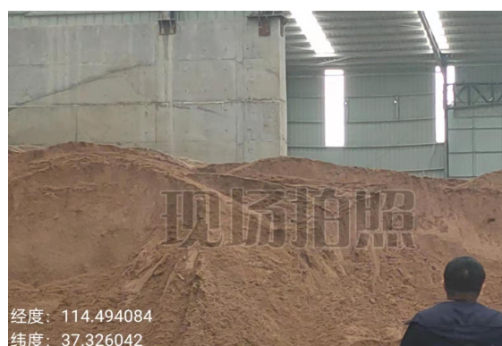
内丘县科冀建材有限公司原料水洗砂

唐山市乐亭县建筑垃圾消纳场，建筑垃圾破碎设备无使用痕迹，未开展过建筑垃圾综合利用；场内及场区周边建筑垃圾随意倾倒，无任何污染防治措施。