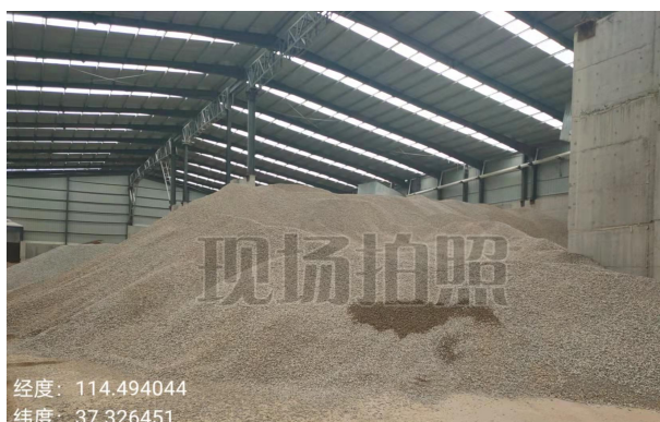
内丘县科冀建材有限公司原料石子

月份之后未再收纳建筑垃圾，而是大量外购石子、水洗砂等原材料，生产商砼直接出售。涉嫌以建筑垃圾资源化利用为名，行商砼生产之实。