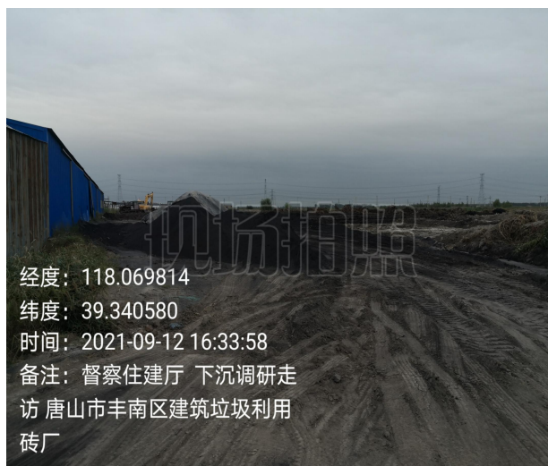
唐山市丰南区永达新型建材厂

唐山市丰南区永达新型建材厂为建筑垃圾资源化利用企业，督察组现场检查时，该厂页岩砖生产线处于生产状态，厂区东侧建筑垃圾堆存带长约 200 米，无任何污染防治措施，建筑垃圾破碎设备无使用痕迹，未开展建筑垃圾资源化利用工作。