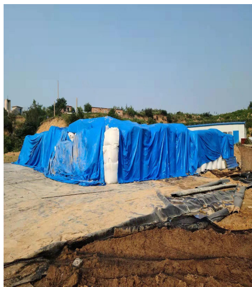
沙河市沙河海创环保科技有限公司大量飞灰露天堆存

石家庄市晋州市华融清润环保能源有限公司，厂内积存飞灰 2400 余吨，远超危废库容量，部分飞灰在车间内违法堆存。