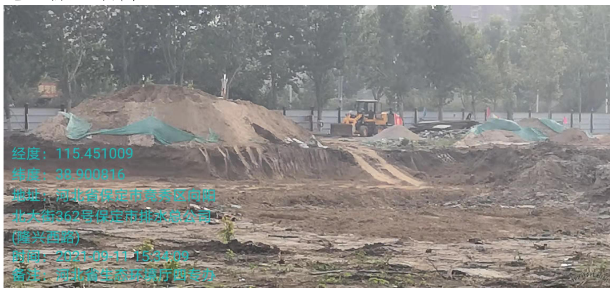
保定市鲁岗污水处理厂（二期）施工工地