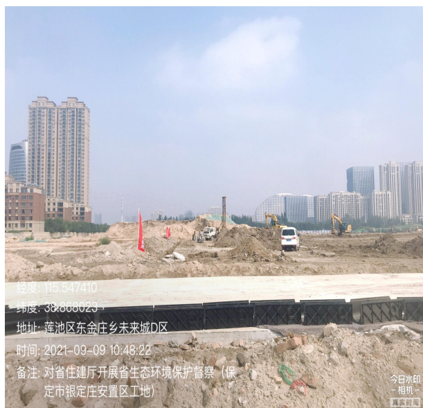
银定庄（付村）安置工地

保定市鲁岗污水处理厂（二期）道路未硬化、土方施工未落实湿法作业、大量施工裸土未苫盖、未见车辆冲洗设施；银定庄（付村）安置工地土方施工未采取湿法作业、场区路面未硬化、工地内露天堆存大量渣土、大面积裸土未苫盖、出入口未设置车辆冲洗设备、未设置扬尘监控和 PM 10 监测设备，无任何扬尘管控措