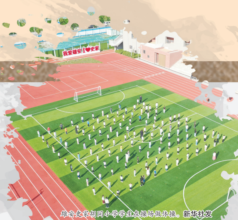
雄安新区同创中学学生在操场做操。

当前，河北正有力有序推进钢铁、焦化、水泥等7个重点行业环保绩效创A工作，以产业含绿量提升发展含金量。截至2023年末，河北环保绩效A级钢铁企业总数36家，数量居全国第一。据了解，接下来，河北将以持续改善生态环境质量为核心，以减污降碳协同增效为抓手，围绕区域绿色低碳发展、大气污染防治、水环境联防联控等领域，深化区域生态环境联防联控机制，让燕赵大地的“颜值”越来越高，京津冀生态环境屏障越筑越牢。